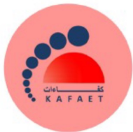
CERTIFICATION LABEL KAF AET