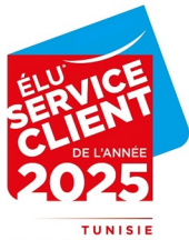
6 FOIS CONSÉCUTIVES Meilleur service client