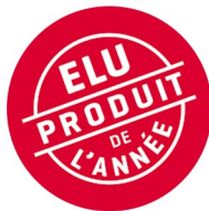
PRODUIT DE L'ANNÉE 2025 Fix Jdid Ooredoo 5G Catégorie Solutions Internet Fixes